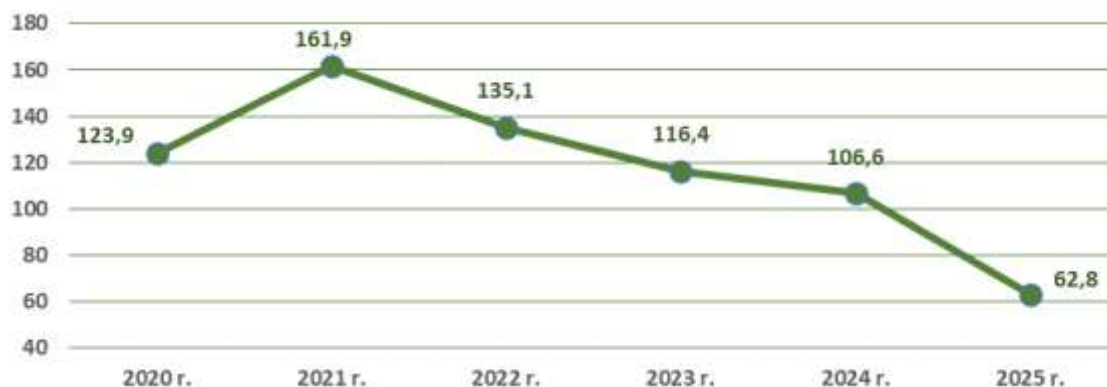
Wykres 2. Liczba ofert pracy w latach 2020 – 2025 (dane w tysiącach)

W 2025 r., w odniesieniu do roku 2024, liczba zgłoszonych ofert pracy oraz ofert o miejscach aktywizacji zawodowej zwiększyła się jedynie wśród Specjalistów o 56 ofert pracy, tj. o 1,1%. W pozostałych grupach zawodów odnotowano spadek, największy wśród Pracowników wykonujących prace proste (o 15 292 oferty, tj. o 52,8%) (zob. tabela 9).